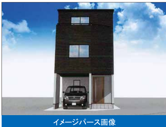
イメージパース画像