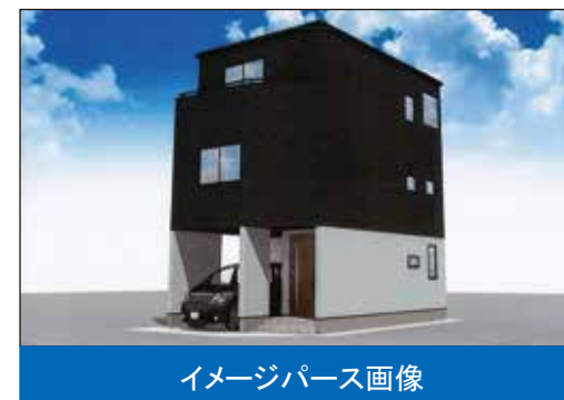
イメージパース画像