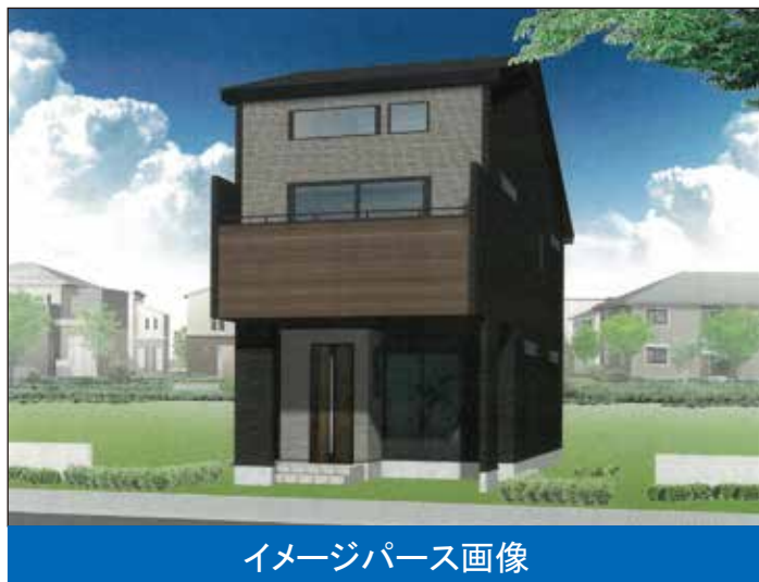
イメージパース画像