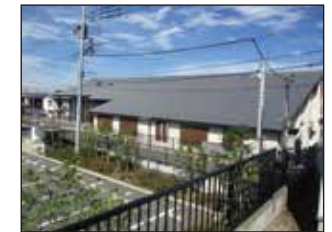
狭山市立武道館(物件裏)