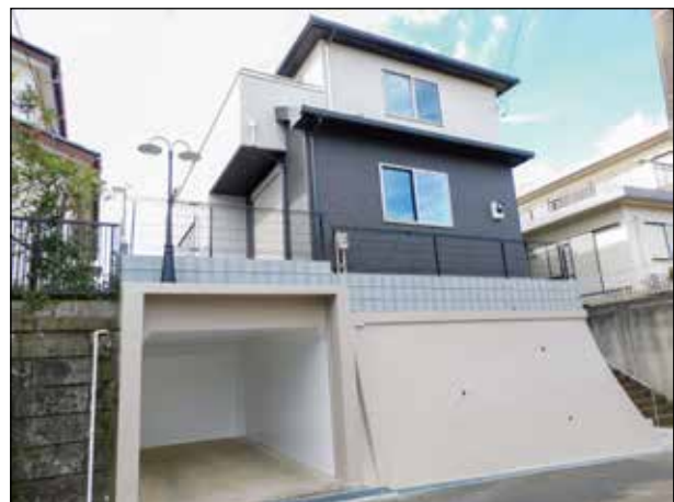
左側隣地は、当社施工物件