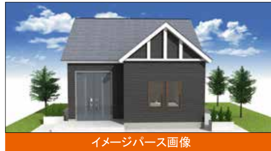
イメージパース画像