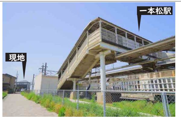
「一本松」 駅 徒歩 1 分