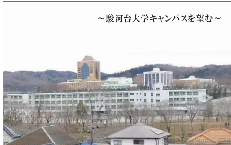
～駿河台大学キャンパスを望む～