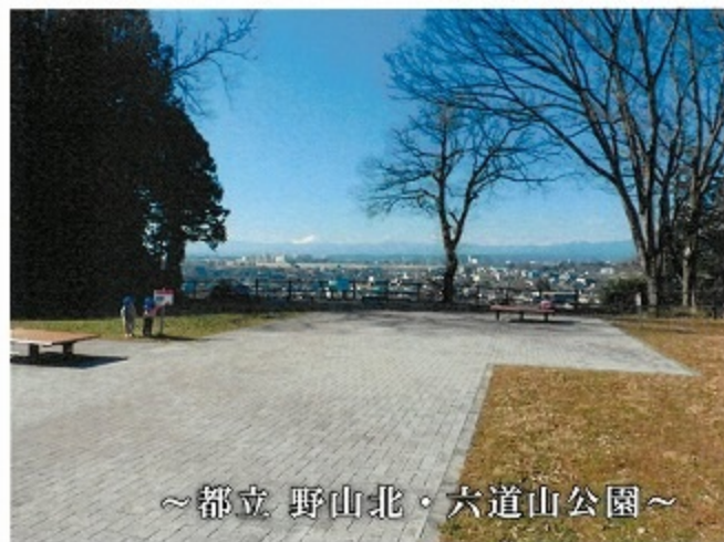
～都立 野山北・六道山公園～